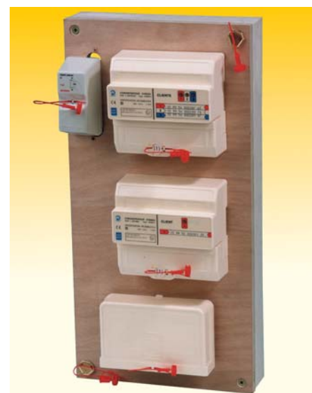
Panneau 4 clients max.