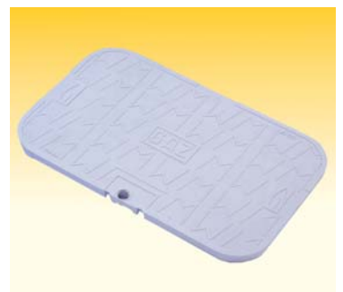
Couvercle CES200 Code GDF 85 00 298 Réf. 1680001