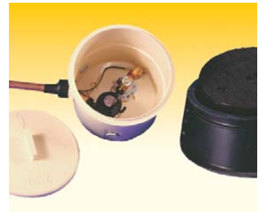
Module BLD900 6m 3 /h Code GDF 85 00 476 Réf. 1689772