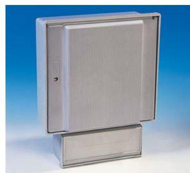
Coffret S15 sur boîtier de repiquage