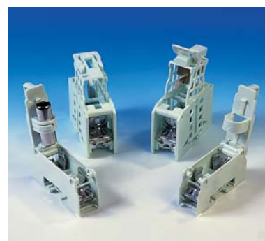
Bases PH et N 22 x 58 Bases PH et N T00