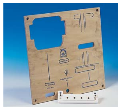
Panneau S15 Code EDF 69 80 079 - Réf. 1217230